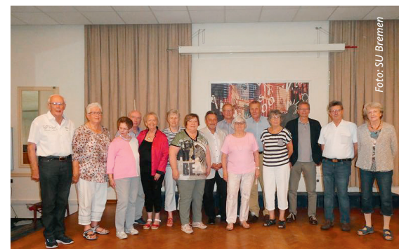
Der neue Landesvorstand.

Alle Vorstände sind bemüht, die Interessen der Senioren konsequent zu vertreten und nach Möglichkeit durchzusetzen.