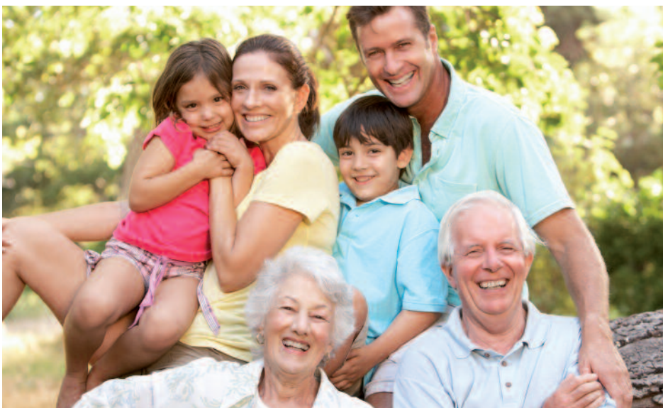
Kinder, Eltern, Großeltern – ein demografisches Bild das sich immer mehr zu Gunsten der Älteren verändert. Diesem demografischen Wandel muss die Politik Rechnung tragen.

Kürzlich durfte man in der NRW-Zeitungslandschaft wieder einmal lesen, dass „die Alten auf dem Vormarsch sind“. Deutschland schrumpfe, die Zahl der über 60-Jährigen steige weiter deutlich an und die Bundesregierung solle sich um die künftige Sicherstellung der Daseinsvorsorge, also die grundlegende Versorgung der Bevölkerung mit wesentlichen Gütern und Dienstleistungen, insbesondere in ländlichen Regionen. Dazu zählen z.B. Verkehrs- und Beförderungswesen oder auch Bildungs- und Kultureinrichtungen. All das ist nicht wirklich neu, aber es zeigt, dass der Handlungsdruck auf Bund, Länder und Kommunen immer weiter zunimmt, die entsprechenden Weichen für eine alters- und generationengerechte Weiterentwicklung unserer Gesellschaft zu stellen.